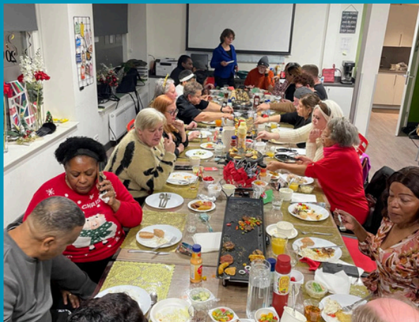
Kerstmaaltijd bij House of Light

We zien vruchten ontstaan aan de (jongere) takken van de ICF boom, zoals House of Light en sinds vorig jaar ook de Turkse geloofsgemeenschap; en we zien andere takken sterk en onafhankelijk worden. Hart voor West staat steeds meer op eigen benen en wij hopen dat zij binnen een paar jaar een volledig zelfstandige gemeente kan zijn. Ook binnen Home for Kurds zien wij groei. Wanneer de evangelist op reis is om huiskerken in het Midden-Oosten te ondersteunen zijn er inmiddels uit de eigen gemeenschap broeders die zijn taken van prediking en onderwijs kunnen waarnemen. Dat is een vrucht van jarenlang met mensen oplopen in hun wandel met God. Het team van Home for Kurds is innig betrokken bij ICF en vinden in de ICF een thuisbasis waardoor zij zich kunnen geven aan hun roeping onder de Koerden.