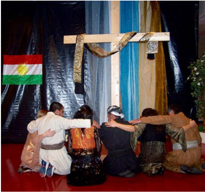
Koerden in gebed