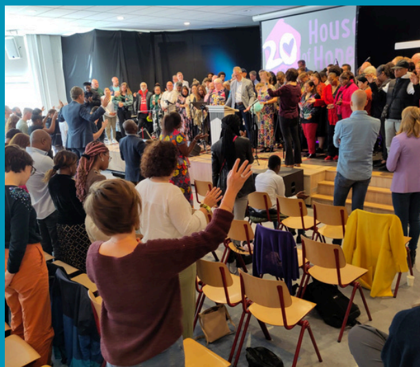
Dankdienst voor House of Hope