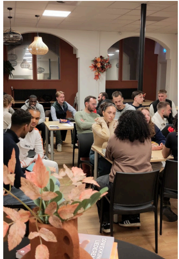
Workshop over relaties & huwelijk voor 18+ groep

→ We zagen ook groei in diepte en breedte onder de jongvolwassenen, die heel zichtbaar zijn in ICF. Ze dragen meer en meer verantwoordelijkheid in de gemeente en dienen in het kinder & jeugdwerk, apologetiekvideo's, worshipteams, voorbede en met praktische taken.