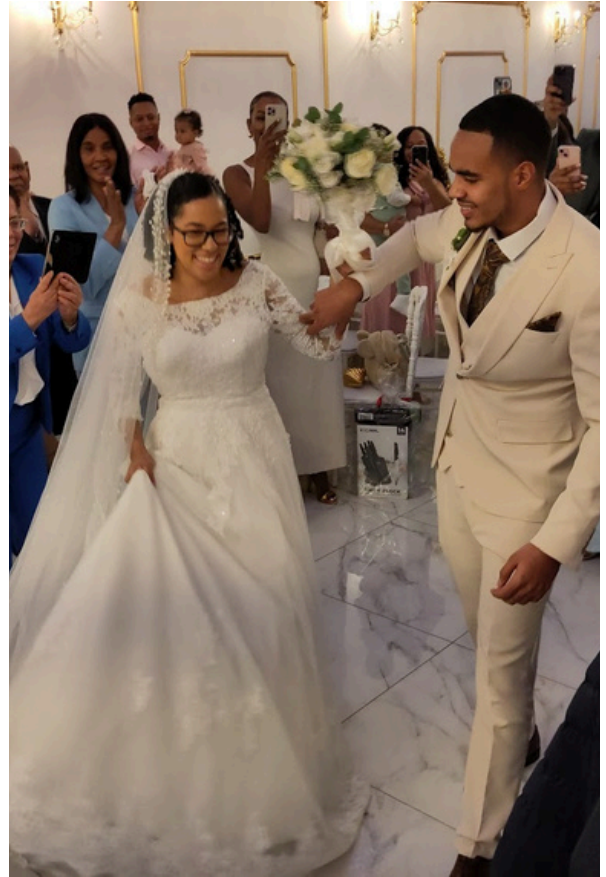
Bruiloft nummer 4 in 2024

→ Door de groei komen we aan de grenzen van de gebouwen die we gebruiken. Op een zondag zitten er vaak 500 mensen in de school de Swaef van het Wartburgcollege. Op drukke zondagen is het puzzelen waar nog een plekje is en worden in de hoeken nog stoelen neergezet. Op een vrijdagavond zijn er soms wel 100 tieners en jongvolwassenen in de Bethelkerk aan de Boergoensevliet. Het begint te wringen en misschien moeten deze twee groepen uit elkaar. Dat zouden we jammer vinden, want het is mooi dat tieners zien wat hun oudere broers en zussen doen. Maar de grootte van de gebouwen is slechts één aspect. Agendadrukke bij pastor, ouderlingen en kerkelijk werkers neemt ook toe door de genoemde groei. We bidden voor wijsheid van God bij het stellen van prioriteiten.